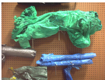
Sacs plastique fondus, 2002 ©Frac Limousin

A partir de 1989 Anita Molinero produit une série de pièces disposées au sol (expositions au Centre de Création Contemporaine – Chapelle des Lazaristes, Tours, et en 1994 à l'Ecole Nationale des Beaux-Arts de Dijon). Les formats deviennent plus importants (90 x 200 x 200 cm), mais ils restent toujours à l'échelle du corps. Des formes de polystyrène moulé viennent s'ajouter à ses sculptures vers 1995. Ce sont à l'origine des emballages pour appareils d'électroménager, sur lesquels elle a coulé du ciment. Parfois, elle y a ajouté des éléments en latex ou encore des chaînes métalliques de vélo ou de moteur.