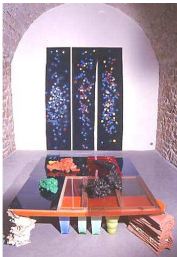
Vue d'ensemble de l'exposition Une suite décorative , 2000, Frac Limousin, Limoges

L'exposition réunit des sculptures anciennes, parfois refaites pour l'occasion, mais surtout des œuvres récentes réalisées pour le Frac et en collaboration avec le CRAFT (Centre de Recherche sur les Arts du Feu et de la Terre de Limoges), après une résidence d'été à l'ENAD (Ecole Nationale des Arts Décoratifs) de Limoges.