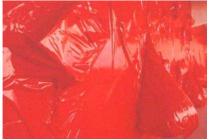
Vue du mur de Vénilia (détail), Le Spot, Mai 2001

Pour le Frac Limousin, elle a aussi choisi de reconstituer un mur de Vénilia, déjà présenté une première fois à la galerie du Triangle à Bordeaux en 2000, et au Havre en 2001. Il s'agit de recouvrir tout un mur de l'espace d'exposition avec du Vénilia coloré, sous lequel se trouvent disposés divers objets ou formes de formats différents. Ainsi, un relief est donné à la paroi recouverte de malformations.