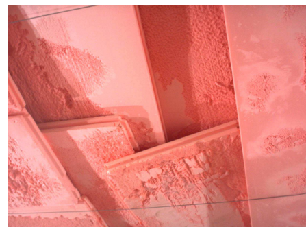
Vue du plafond de Polyfoam fondu, Frac Limousin, 2002

Ainsi, d'une sculpture associative et comme malmenée jusqu'au troublant équilibre de ses débuts, s'est-elle progressivement tournée vers une sculpture envahissante qui « boursoufle » le mur ou devient quelque peu menaçante, suspendue au-dessus de nos têtes.