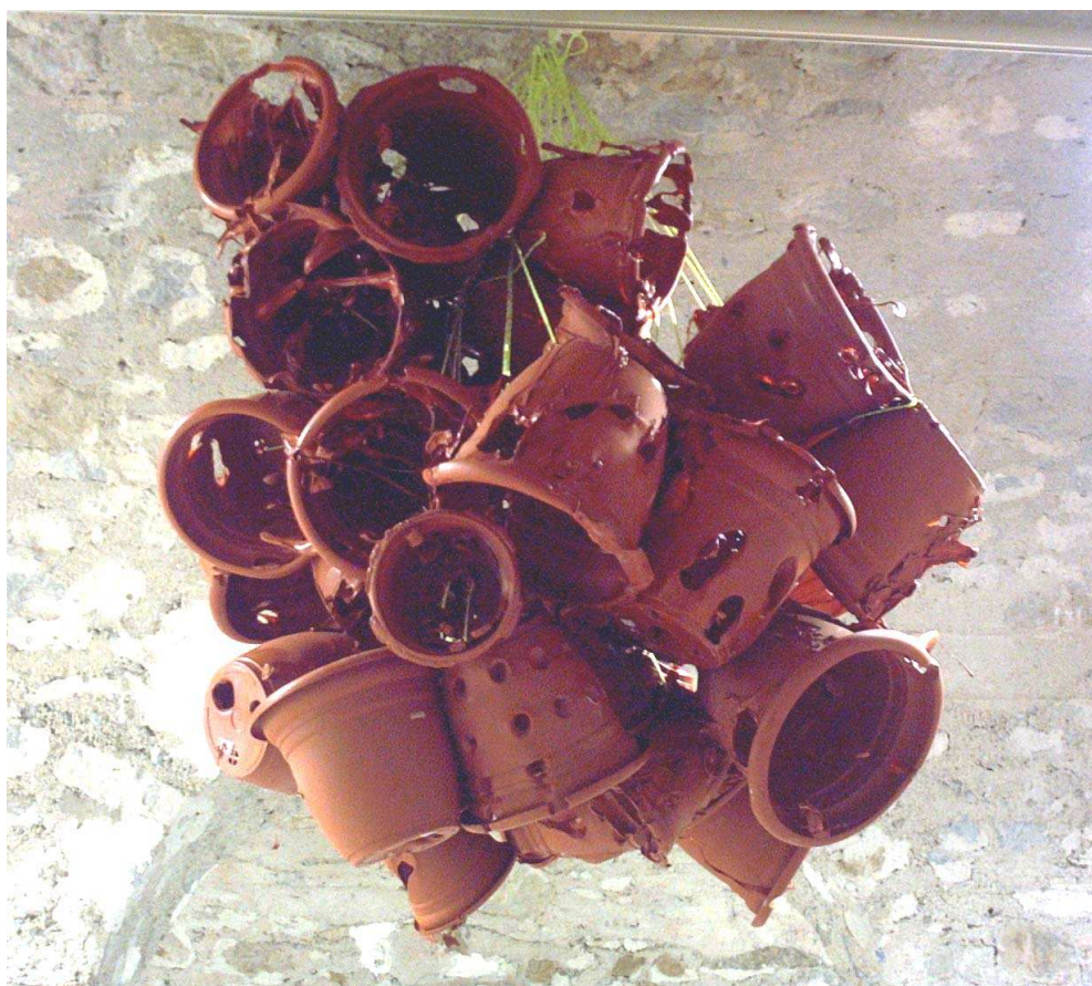
Cache-pots en plastique, cordes, 2001 Dimensions variables, prêt de l'artiste