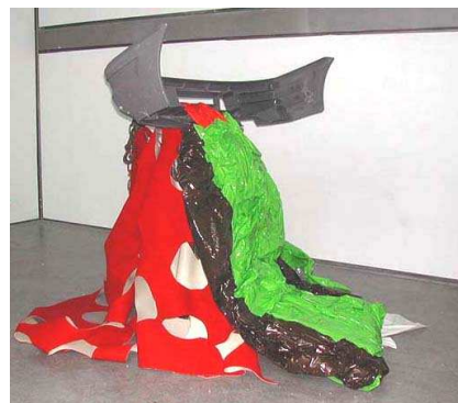
Vue dans l'atelier de l'Ecole Nationale des Arts Décoratifs de Limoges, été 2002

Cette volonté de travailler avec des matériaux nouveaux l'entraîne à introduire des vêtements dans ses sculptures assemblés avec du carton, de la mousse et/ou du plastique. Dès 1988 elle y ajoute des objets du quotidien (cuvette, couvercles de poubelles, bouteilles et bidons).