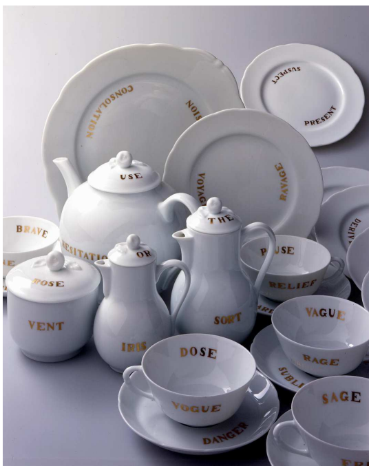
Martine Aballéa Garden Party, 1996 Collection FRAC Limousin

Née le 11 août 1950, New York. Habite Paris depuis 1973.