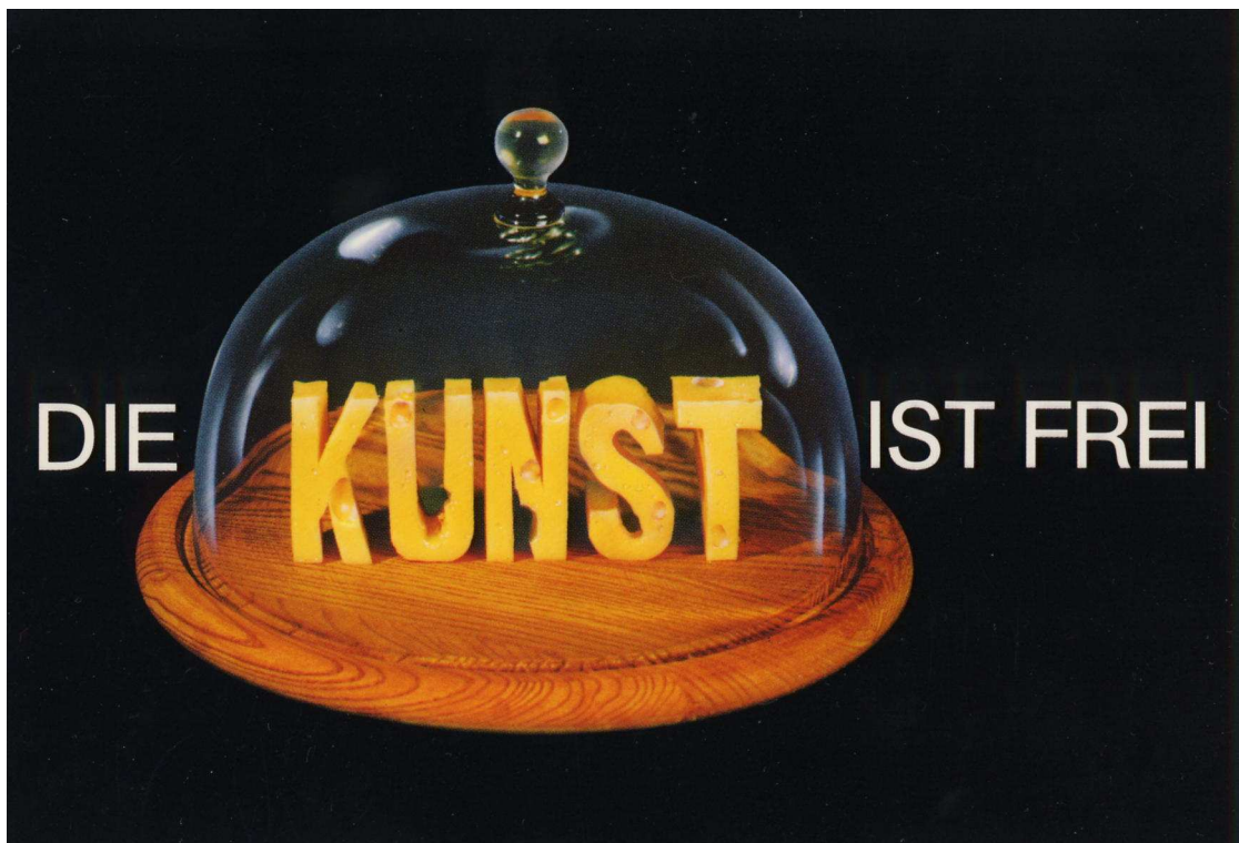
Klaus Staeck, Die Kunst ist frei , 1987 Affiche, 84 x 59 cm, Coll. FRAC Limousin, © Edition Staeck