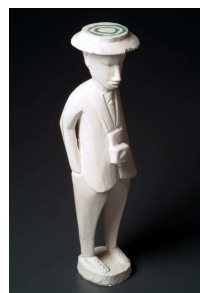
Philippe Poupet, Casque de fusion, 1999

Philippe Poupet investit les espaces fortement chargés d'histoire de la Porte Saint-Jean . Résident de l'année 2002, il s'était impliqué dans une nouvelle recherche de « sculpture à l'envers » à laquelle beaucoup d'élèves participèrent. Il s'agissait de révéler (en positif, par du plâtre coulé) des gestes contrariés (creusés dans des blocs de polystyrène), et d'agir, par là, sur des formes de l'inconscient collectif.