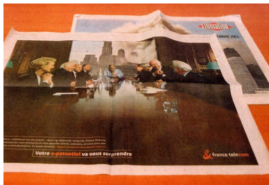
Laurent Chambert, Couvertures , 2001