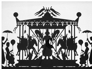
Alain Séchas, Petites découpes en papier noir , 1994