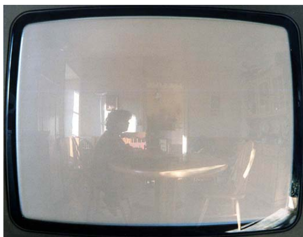
Richard Monnier Foyer , 1989 Photographie couleur, 40 x 50 cm Collection FRAC Limousin

exposition du 24 novembre au 18 décembre 2009