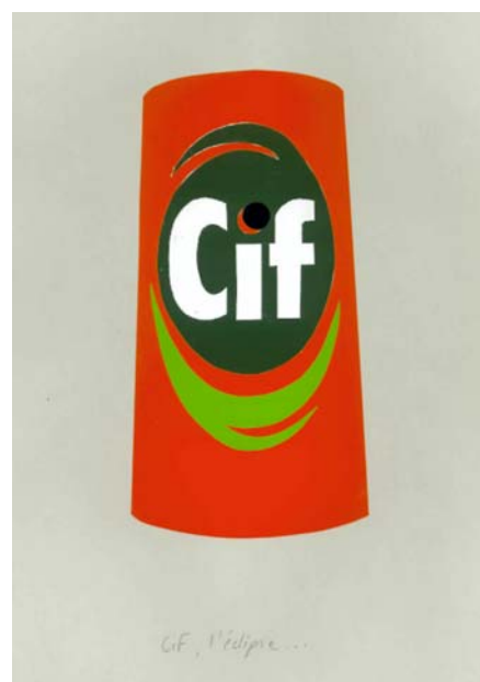
Richard Fauguet Cif l'éclipse... Sans Titre , 1999 Collage, vénéria sur papier, 30 x 21 cm Collection FRAC Limousin

Galerie du Théâtre de l'Union Centre Dramatique National 20 rue des Coopérateurs B.P. 206 87100 Limoges Cedex 1 tél. : 05 55 79 74 79 www.theatre-union.fr