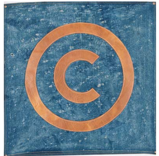
General Idea Leather and Denim. Copyright n° 5, 1987 Oeuvre textile, cuir sur toile de jean et rivets, 69 x 69 x 8 cm Collection FRAC Limousin / ©F. Magnoux