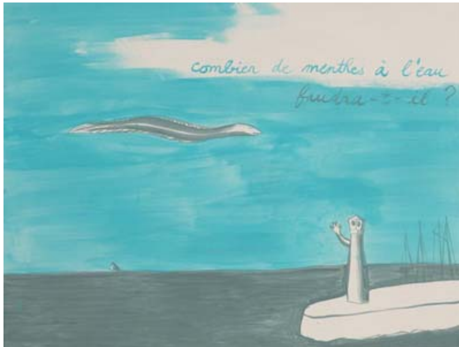
Yves Chaudouët Ce feu , 2006 Sous-titre : Combien de menthes à l'eau faudra-t-il ? Acrylique sur toile, 90 x 120 cm Collection Frac Limousin

Centre Dramatique National du Limousin 20 rue des Coopérateurs, Limoges