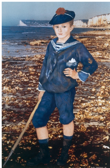
Jeune garçon sur la plage d'Yport d'Auguste Renoir, 1906 Collection FRAC Limousin