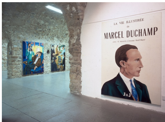
Vue de l'exposition Gabriele Di Matteo, FRAC Limousin 2002, œuvres de la collection FRAC Limousin.