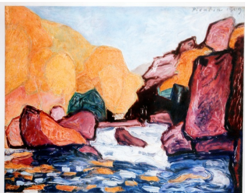
La Sédelle de Francis Picabia, 2006 / Collection FRAC Limousin