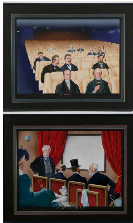
Les précurseurs et La projection du 1 er film Lumière, 1977-78 Collection FRAC Limousin

Dans la continuité des séries "les peintures recommencées ", "les déchirures " et à partir de la même démarche documentaire, André Raffray trouve un nouveau moyen d'associer peinture et photographie puis peinture et cinéma.