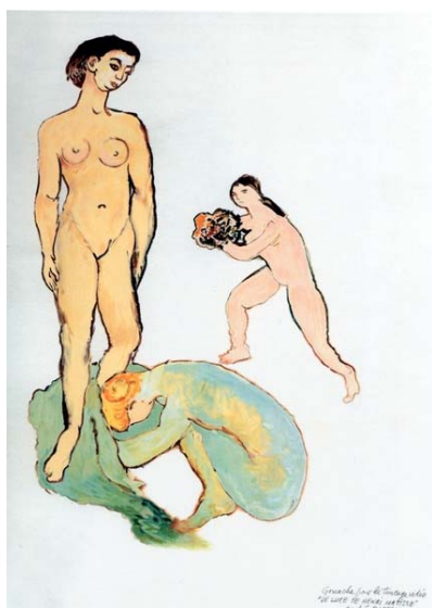
Gouache pour le trucage vidéo « Le Luxe » de Henri Matisse, 1996 Collection FRAC Limousin

Il réalise Jeune garçon sur la plage d'Yport d'Auguste Renoir en 1996 en intégrant sur le tirage photographique au format de la peinture originelle, l'image peinte à la gouache du jeune Robert Nunes. L'ambiguïté de ce voyage dans l'espace et le temps s'accélère d'autant plus avec Le Luxe d'Henri Matisse . Grâce aux trucages cinématographiques, le découpage des trois personnages laisse apparaître la baie de Sainte Maxime où se croisent de temps à autre quelques voiliers blancs. (seul le dessin préparatoire ayant servi au trucage est présenté à la Chapelle St Libéral)