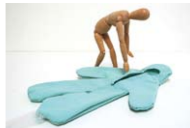
Kristina Depaulis Mets-ta mémoire / maquette , 2003