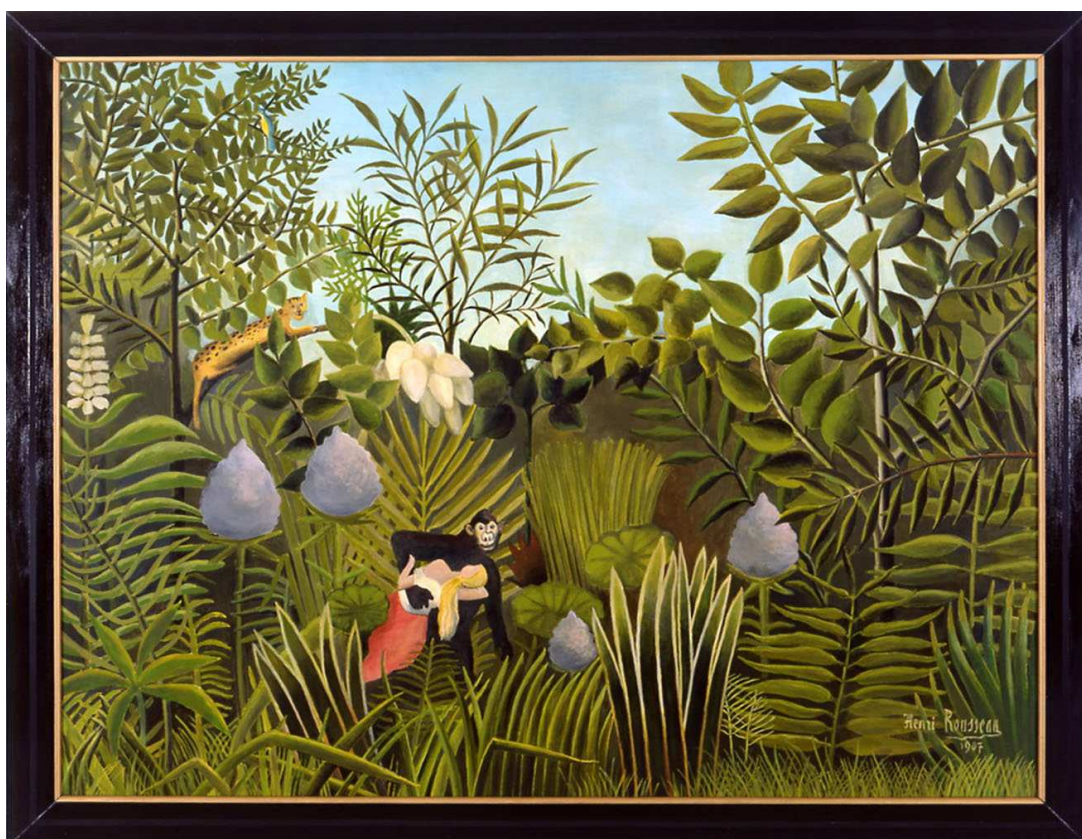
Ernest T., Le voleur de femme , 2002, coll. Frac Limousin

exposition du 4 juillet au 18 octobre 2003