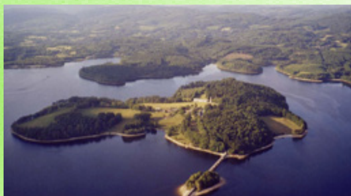
Ile de Vassivière (Creuse)

Située en plein cœur d'une région magnifique, à 3 heures de Paris, à 2h30 de Bordeaux, Toulouse et de l'océan, Limoges bénéficie d'un cadre de vie apaisé et d'un environnement naturel exceptionnel.