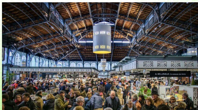
Les halles centrales de Limoges

Avec l'Opéra, le Théâtre de l'Union - Scène Nationale, trois musées dont le musée national Adrien Dubouché, une biennale de danse contemporaine, un festival de jazz et le festival des Francophonies, Limoges est aussi reconnue pour sa scène culturelle et sa convivialité.