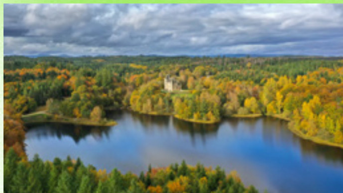
Château de Sédrières (Corrèze)

La Région Nouvelle-Aquitaine place la création au cœur de sa stratégie de développement culturel et économique. C'est dans ce contexte que se développe le projet artistique et culturel du Frac-Artothèque Nouvelle-Aquitaine qui ouvrira un nouveau site au printemps 2025 en hyper-centre de Limoges dédié à la création contemporaine.