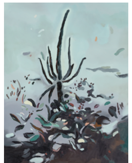
Nelly Monnier Brumaire , 2018 — 2019 issue la série Calendrier révolutionnaire Peinture 116 x 89 cm Collection Frac Frac-Artothèque Nouvelle-Aquitaine © Nelly Monnier