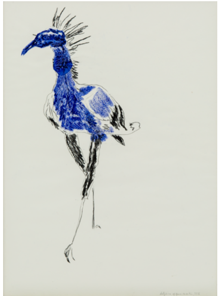
Delphine Gigoux-Martin Sans titre, 2016 Fusain et encre sur papier 57,5 x 41,5 cm Collection Artothèque Frac-Artothèque Nouvelle-Aquitaine