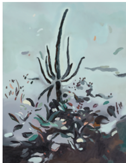
Nelly Monnier Brumaire , 2018 – 2019 issue la série Calendrier révolutionnaire Peinture 116 x 89 cm Collection Frac Frac-Artothèque Nouvelle-Aquitaine © Nelly Monnier

En partenariat avec la Communauté de communes Xaintrie Val'Dordogne et Peuple et Culture Corrèze