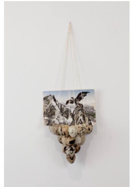
Chloé Piot Olympe , 2009 Sculpture 35 x 12 x 12 cm Collection Frac Frac-Artothèque Nouvelle Aquitaine © SAIF