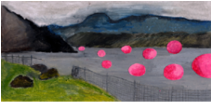
Frédérique Metzger Résidence/réminiscence , 2007 pastel, mine de plomb, collage sur papier 11,8 x 21,8 cm Collection Artothèque Frac-Artothèque Nouvelle-Aquitaine