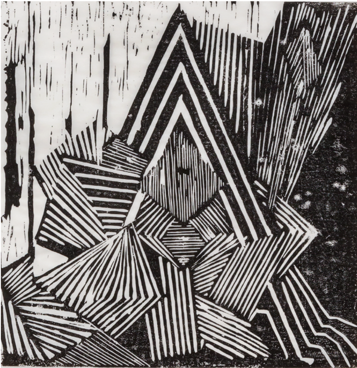
Caroline Achaintre Spear-Spark , 2010 Linogravure 71 x 50 cm Collection Artothèque Frac-Artothèque Nouvelle-Aquitaine